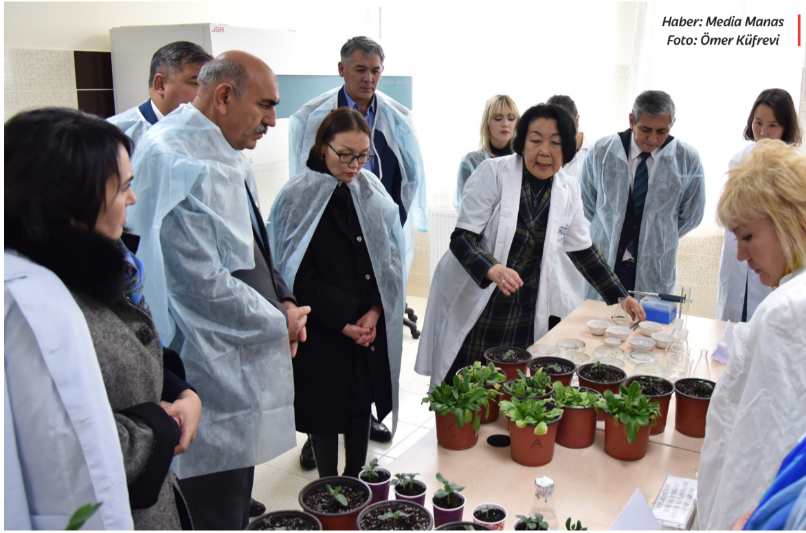
Haber: Media Manas

ji ve inovasyonla ilgili olarak elindeki bütün imkânları kullanıyor. Elbette her zaman her tür imkân elde olmayabilir; ama eldeki imkânları en iyi şekilde ve en gerekli yönde kullanarak çalışmak önemlidir. Üniversitemiz ile ortaklaşa gerçekleştirilen bu proje, doğrudan halkın hizmetine yönelik bir projedir. Kırgızistan'ın kalkınması adına tarım ve hayvancılık büyük